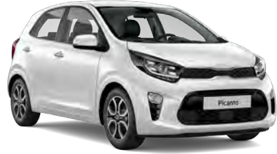
Alp Beyaz (UD)