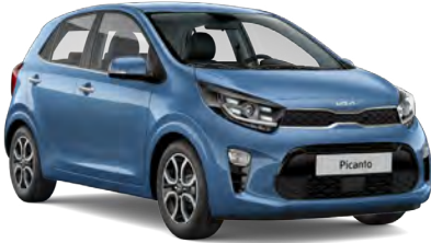
Pudra Mavi (ABB)