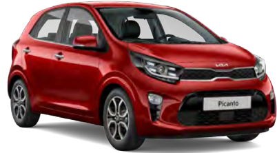
Alev Kırmızı (A2R)