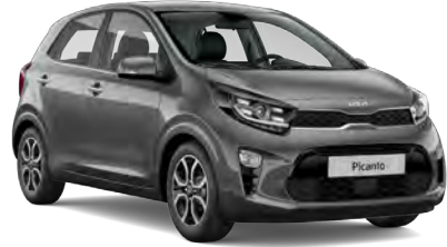
Astro Gri (M7G)