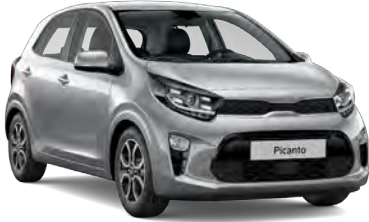
Gümüş Gri (KCS)