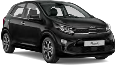
Galaksi Siyah (ABP)